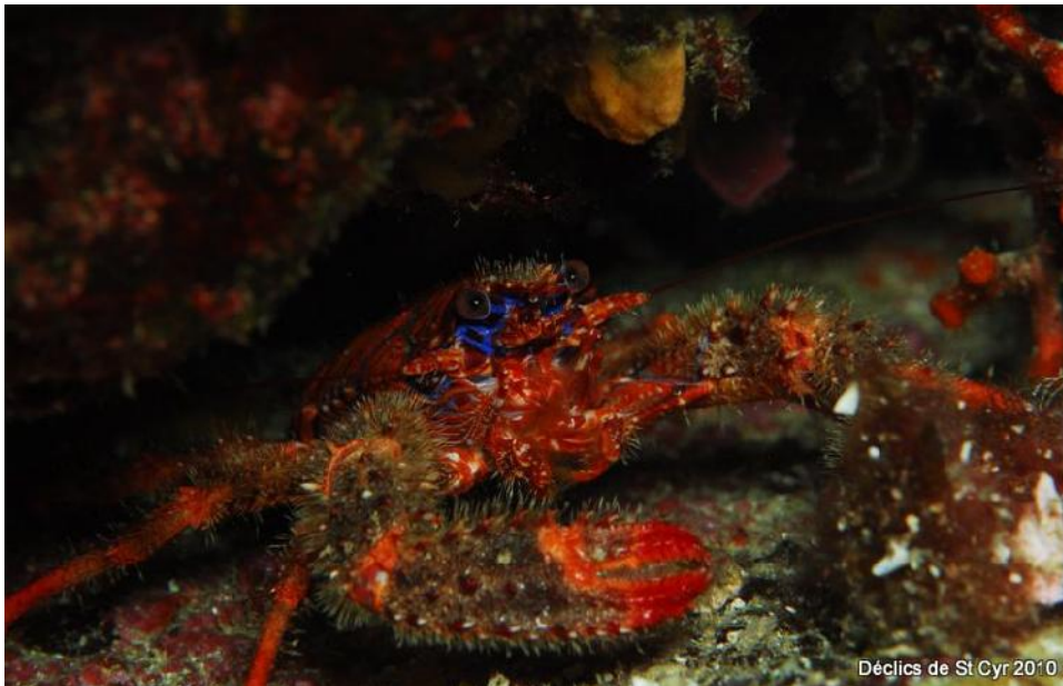
Déclics de St. Cyr 2010