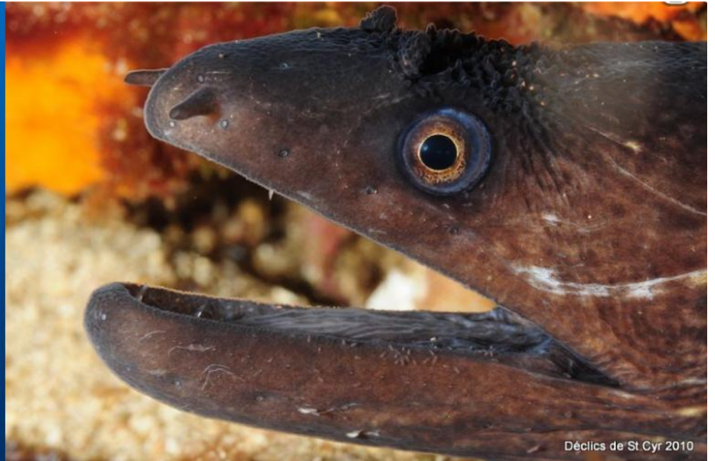
Déclics de St. Cyr 2010